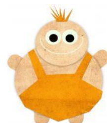
Kinder erstellen einen Trickfilm in der Trickfilmwerkstatt, rechts daneben der „Goldene Kugelkönig“

Im Jahr 2016 konnte die Stadtbücherei wieder eine verstärkte Nutzung verzeichnen. Ein Umsatz , also eine durchschnittliche Ausleihe von mehr als fünf