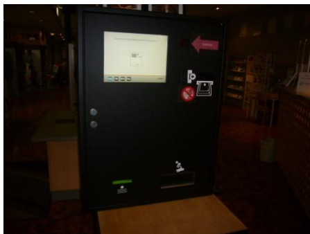
Der neue Kassenautomat

Mit der Installation und Inbetriebnahme des neuen Kassenautomaten im September 2016 ist die Einführung der Selbstverbuchungsausleihe erfolgreich abgeschlossen . Die Ausleihstationen wurden bereits 2015 in Betrieb genommen. 2014 war die Umrüstung der Mitarbeiter-Arbeitsplätze und der Medien erfolgt. Die Einführung der neuen Verbuchungstechnik hat damit drei Jahre in Anspruch genommen. Bei der Benutzerumfrage Ende 2016 bekundeten 97% der Teilnehmer/innen, dass ihnen die Nutzung der Geräte keine Schwierigkeiten bereitet.