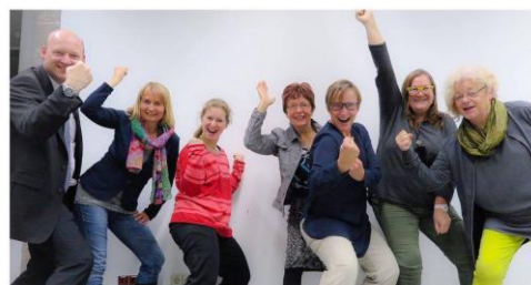
tür-auf:theater – Probe in der nächtlichen Bücherei

In der Bücherei lernen täglich Schülerinnen und Schüler auf Klassenarbeiten oder erledigen zusammen die Hausaufgaben. Migrantinnen und Migranten treffen sich zum gemeinsamen Deutschlernen oder nutzen die Einzelarbeitstische für ihre persönliche Weiterbildung. Manch einer bereitet sich hier auf einen Schulabschluss vor. Im gemeinsamen Schulungsraum von Bücherei und VHS wird von morgens bis spät abends gelernt . Am Vormittag sind es meist Schulklassen oder Kindergartengruppen die hier die Stadtbücherei und ihr Angebot kennenlernen. Am Nachmittag treffen sich selbst organisierte Lerngruppen wie die PC-Gruppe des Kreissenioresrates oder Jugendliche die mit dem Schulungscomputer Raspberry-Pi gemeinsam Programmieren lernen . Am Abend wird der Raum für Integrations- oder Kunstkurse der VHS aber auch für ein privates Theater-Projekt genutzt. Im Lesecafe treffen sich derweil Arbeitsgruppen (z.B. das Kulturherbst-Team, der Vorstand des Geislinger Literaturnetzwerks oder der Beirat der VHS) und Lesecubs. Auch der Jugendgemeinderat und der Stadtseniorenrat bieten hier ihre Tablet-Kurse für Seniorinnen und Senioren an. So ist oft bis zum späten Abend noch Leben in der Bücherei.